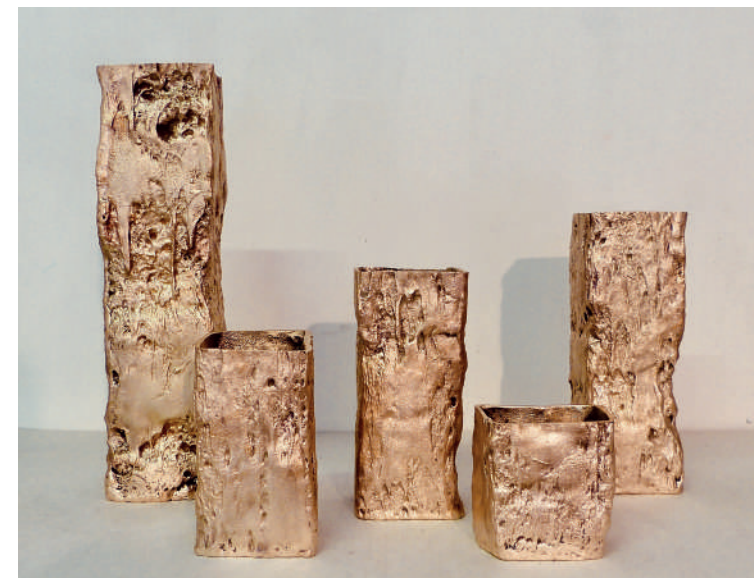
JANINE THÜNGEN-REICHENBACH VIVE E LAVORA TRA VENEZIA E ROMA WWW.JANINEVTHUNGEN.COM

A / RECTO/VERSO / 2017 carta Washi dalla serie Tempo Trasposto pezzo unico - Washi paper from the series Time Transposed unique piece - 160 x 160 x 30